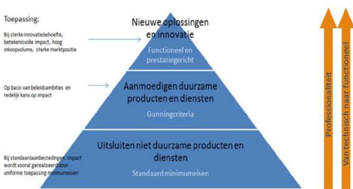
Figuur1. Ambitieniveaus MVOI

De MVOI-menukaart is een tool om duurzaamheid beter te kunnen borgen in een aanbesteding, in het contract en uiteindelijk in de praktijk. Het doel van deze menukaart is om inzichtelijk te maken hoe duurzaamheid uitgevraagd kan worden per aanbesteding en hoe dit meetbaar gemaakt kan worden.